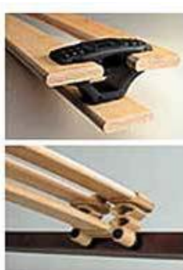
Рис. 9 и 10

Сами по себе ортопедические основания еще и усиливают гигиеничность матраса, так как благодаря зазорам между латами, воздух свободно проникает и циркулирует внутри изделия, а влага беспрепятственно испаряется. Использование основания дольше сохраняет матрас в первоначальном виде, не дает скапливаться пыли.